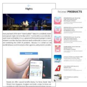
韓国の最新トレンドについて紹介 〈Trend Korea〉