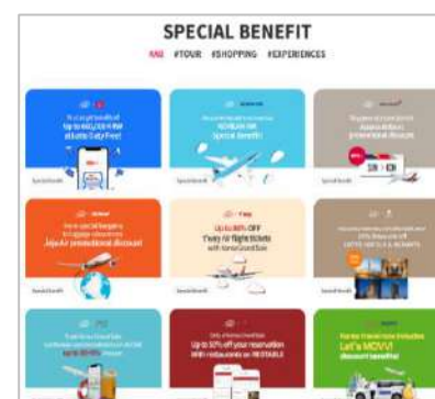
主要企業の特別企画展 〈Special Benefit〉