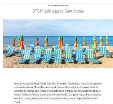
韓国の観光スポットについて紹介 〈Featured Location〉