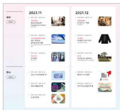
月別の特典とイベントの情報 〈Calendar〉